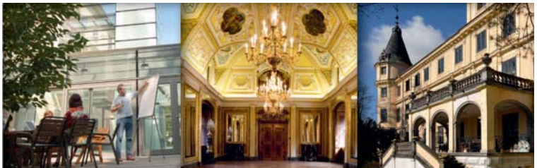
Schloss Puchberg, Wels, OÖ