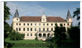
Schloss Puchberg, Wels, OÖ